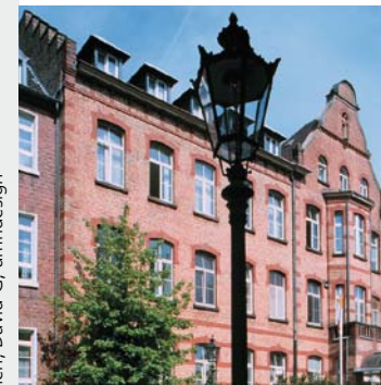
11/2010 (Druckfehler und Änderungen vorbehalten); Fotos: Paul Esser; © fotolia.de: Aaron Chen, David G., amrdesign