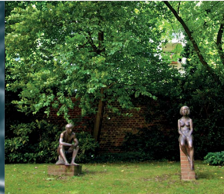
MHD_2015_013_SH_02/2015 (Änderungen und Druckfehler vorbehalten.) Die Fotos sind zu Demonstrationszwecken gestellt.